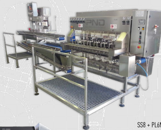
SS8 + PL6M